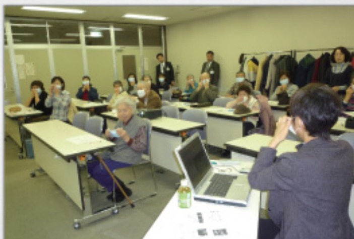
正しいマスクの装着法を実技でチェック