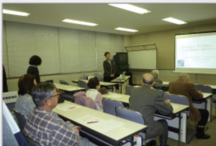
初雪となった当日も多くの方が来場されました