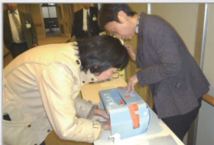
蛍光塗料を手につけて、普段通りに手洗い後 機械でチェック。意外に残りが見つかった方も・・・